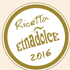
FOTO PRODOTTO / Photo product