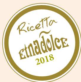
FOTO PRODOTTO / Photo product